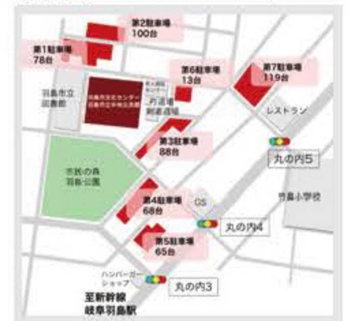
羽島市文化センターアクセスマップ